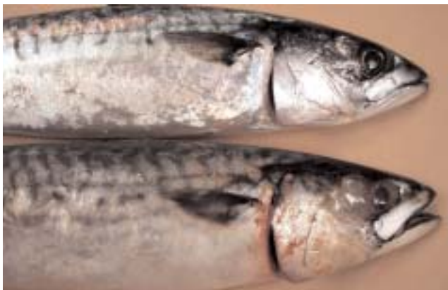
Ovan: Färsk makrill. Nedan: gammal makrill